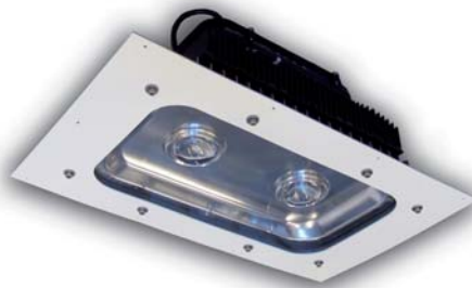
Variante für Deckeneinbau

Zum deckenbündigen Einbau sind Versionen mit Frontblende und verschiedenen Einbaurahmen erhältlich. Die Blenden können in allen RAL-Farben nach Wunsch lackiert werden.